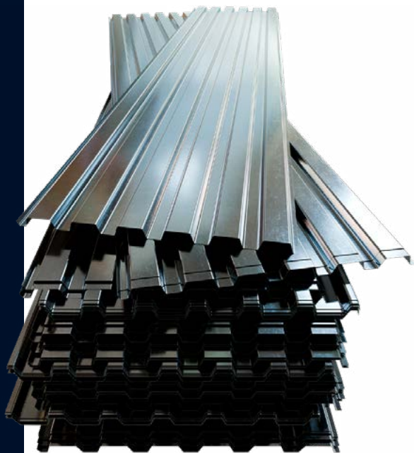
LÁMINA RD 91.5